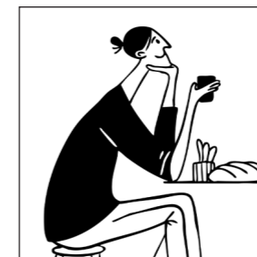
Team Editionen (Drucksachen)