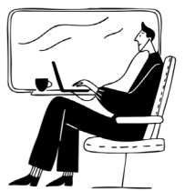
Mitgliederinformation und -administration

Wir arbeiten intern wie extern gerne mit Partner:innen zusammen.