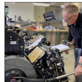
Team Räume und Angebote (Atelier)